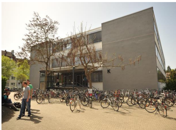
Karlsruhe University of Applied Sciences

留學德國: Karlsruhe University of Applied Sciences, www.hs-karlsruhe.de